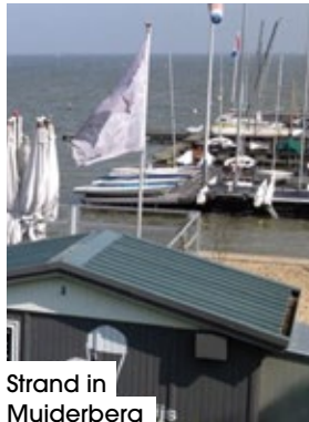
Strand in Muiderberg