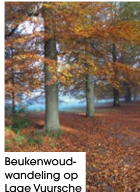
Beukenwoud- wandeling op Lage Vuursche