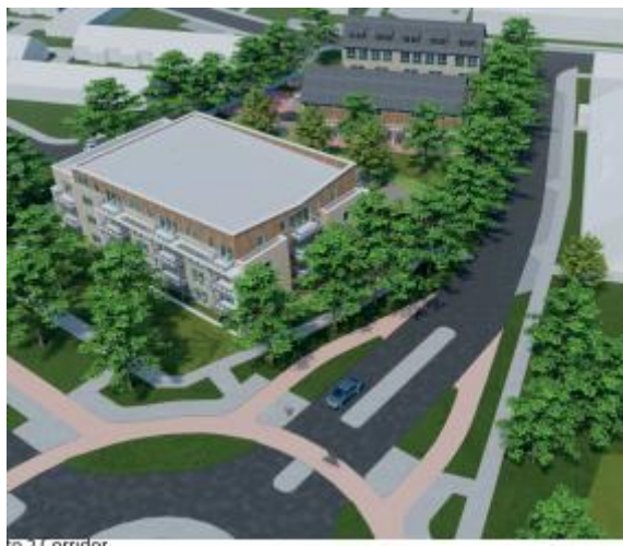
Figuur 1 model corridor